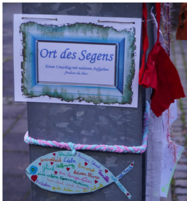
Der Einstieg in das Projekt war ein voller Erfolg!

Clemensplatz 7, 47807 Krefeld Tel. 7193101 b.schmitz (*)maria-frieden-krefeld.de